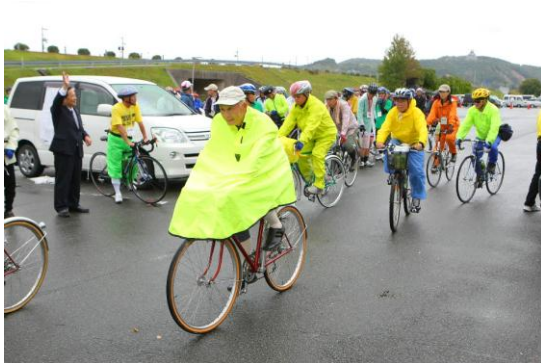
全国大会 三重サンアリーナ出発風景 コースごとに分かれて出発