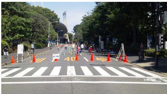
小学生以上の自転車の乗り方教室風景 1