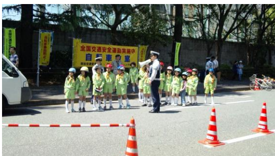
四谷警察署共催の自転車教室