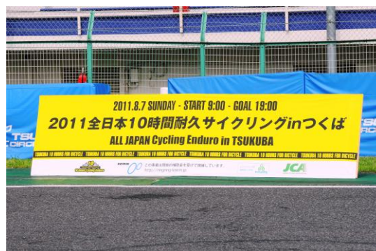
プレゼント当選者等記念撮影用大会バナー