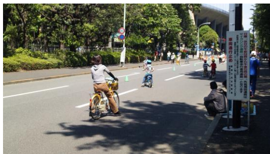
小学生以上の自転車の乗り方教室風景 2